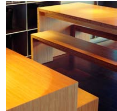
Moso® Massieve plaat Side Pressed Naturel