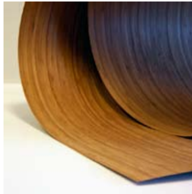
Moso® Fineer Side Pressed Caramel