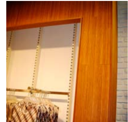
Moso® Bamboe op de Rol Panda Caramel