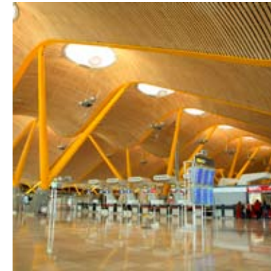
Moso® Fineer Side Pressed Naturel