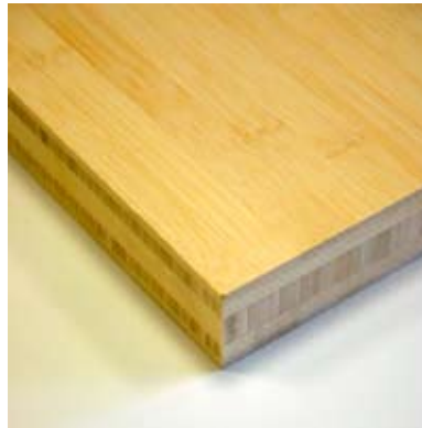
Moso® Massieve plaat Plain Pressed Naturel